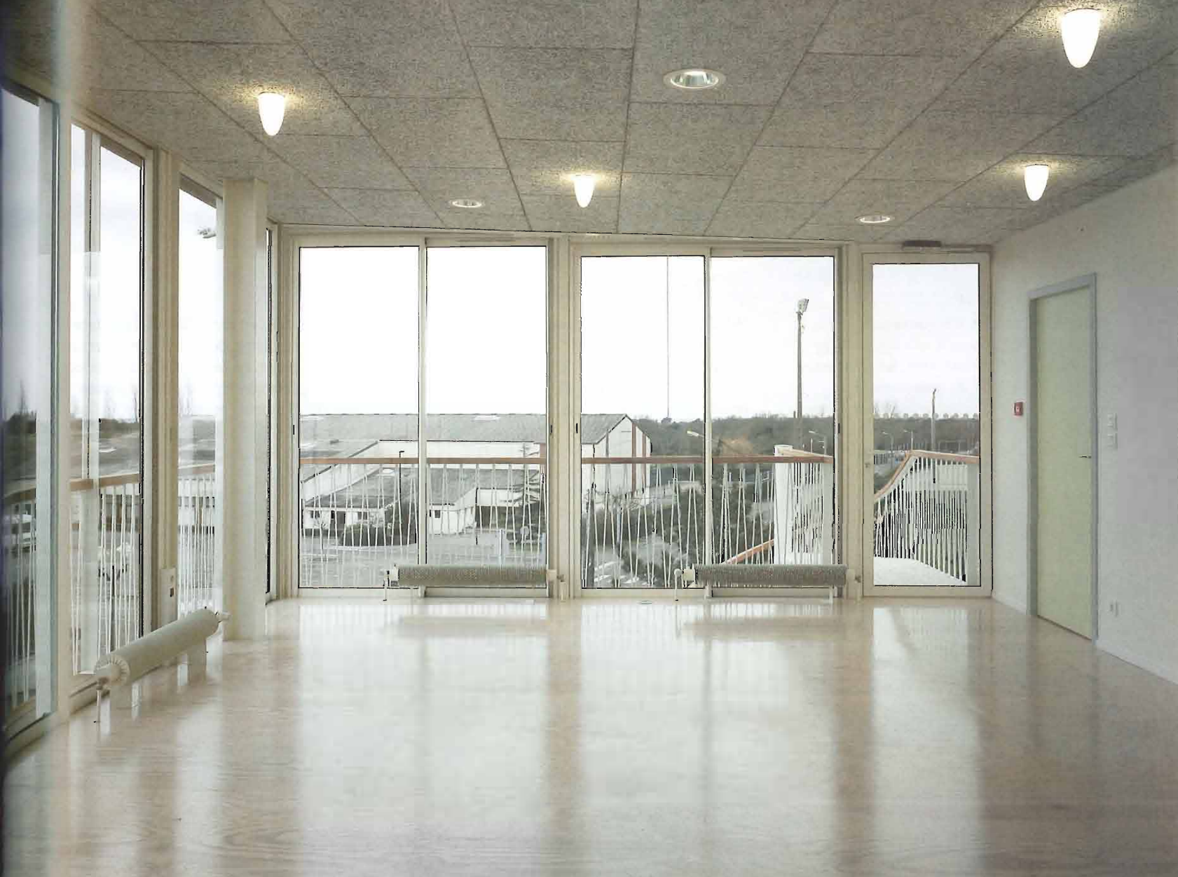
Ci-dessus, les espaces intérieurs de l'extension. En page de gauche, vue de la cour intérieure et de la coursive filante.